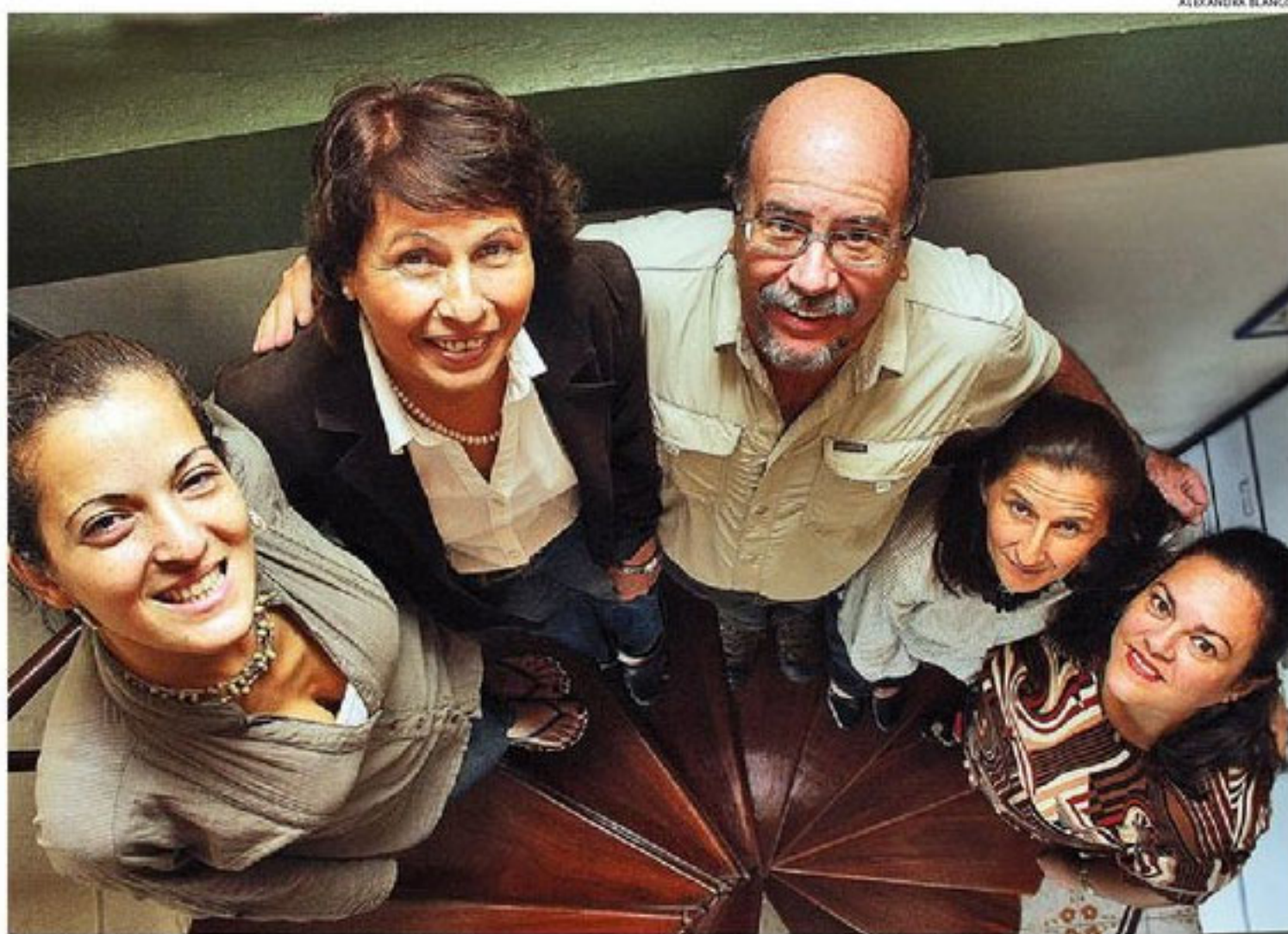
El equipo del CICE ha implementado una metodología para ayudar a los maestros en su trabajo pedagógico